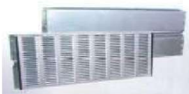
統一型吸音板・両面吸音板