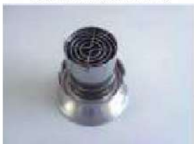
業務用調理機器排煙ダクト