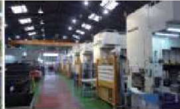
大型プレスライン(9連)