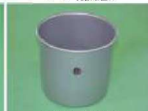
業務用掃除機深絞り部品