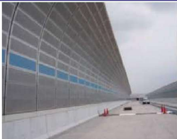
第二京阪(前背面分離型吸音板)