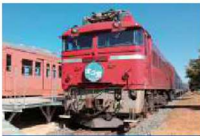
北斗星 電気機関車 EF81