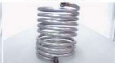
大型給湯器用蛇管