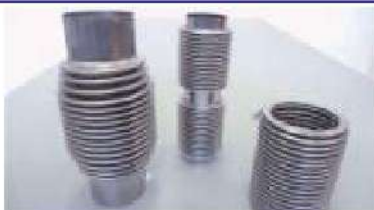
ペローズ加工(自動車排気ガス用)