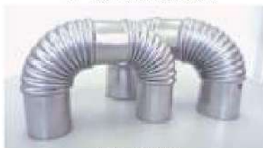
ボイラー用Uベント