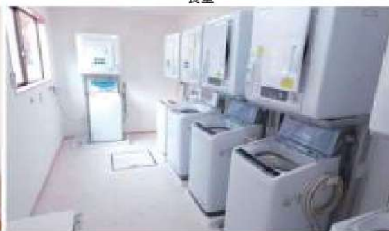
ランドリールーム