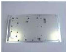
工作機械部品(プレートアッシー)