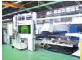
パンチ・ファイバーレーザー複合加工機