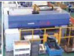
シングルパンチ式ガトリングプレスセンタ