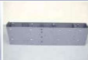
パチスロ部品(メダルサンド)