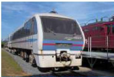
鹿島臨海鉄道 マリンライナー はまなす