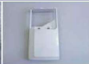
ストーブ外装部品