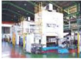
400t大型ロボットライン(9連)