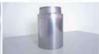
自動車マフラー触媒排気管