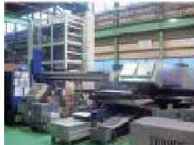
パンチ・レーザー複合加工機