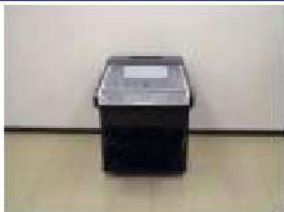
アミューズメント機器