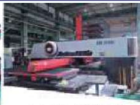
パンチ・CO 2 レーザー複合加工機