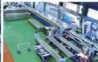
吸音板ロール成形、スポット溶接ライン