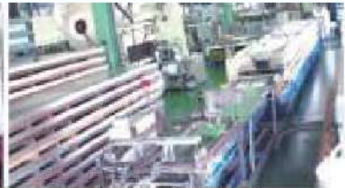
ロールフォーミング成形ライン