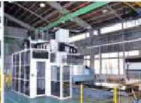
5面加工門型マシニングセンタ