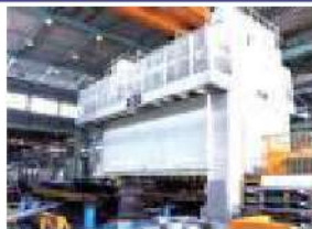
1500tトランスファープレス