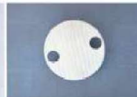
熱交換器プレート