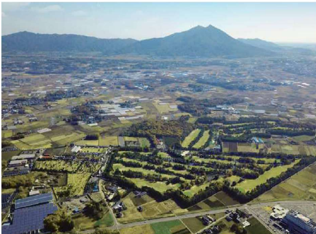
下館ゴルフ倶楽部

ザ・ヒロサワ・シティは、「自然・健康・文化」をテーマに、スポーツと教育を通して皆様とのふれあいを大切に、地域の発展を目指しております。皆様のご利用を心よりお待ちしております。