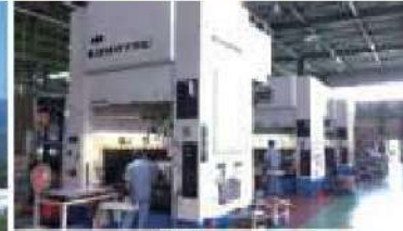
大型プレスライン