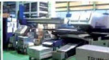
パンチ・レーザ複合加工機