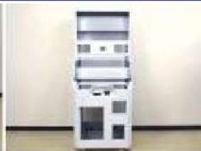
アミューズメント機器