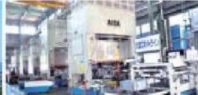
搬送ロボット付500tプレスライン