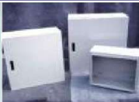
電気・電子機器収納キャビネット