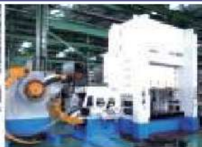
300t順送サーボプレス