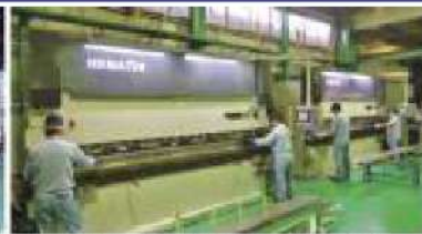
NCプレスブレーキ(110t・225t 4000mm対応)