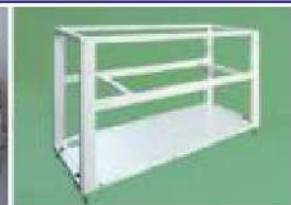
レーザー発振器筐体