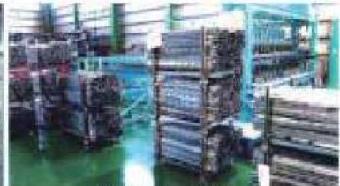
液体パレット 自動溶接ライン