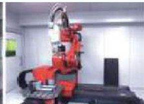
ファイバレーザ溶接ロボット