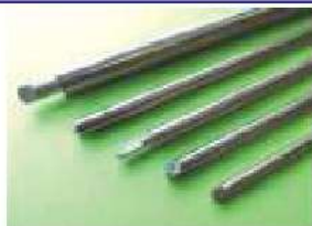
トナーカートリッジ用ローラー芯金