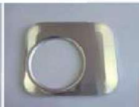
レンジフード部品(オイルガード)