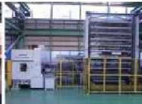
GT3300ガトリングプレスセンタ