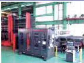
パンチ・ファイバーレーザー複合加工機