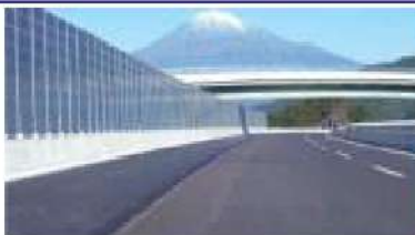
第二東名道 統一型吸音板