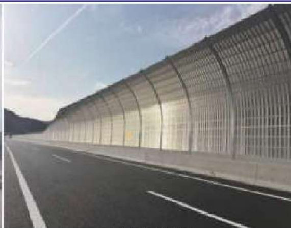
新名神(統一型吸音板)