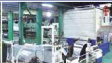
200t前面ルーバー加工ライン