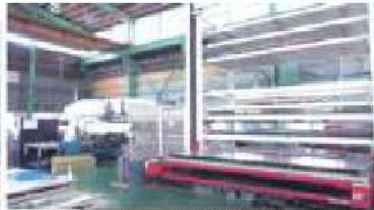
NCタレットパンチプレス(1500×4000mm材対応)