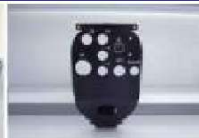
工作機械部品(分線板)