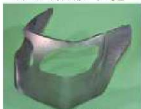
トラクターフロントグリル