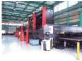
パンチ・ファイバレーザ複合加工機