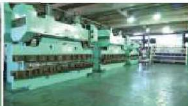
プレスブレーキ(200t 4000mm対応)