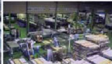
特殊吸音板組立ライン