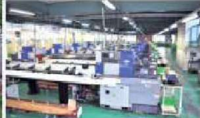
自動棒材供給機付精密自動旋盤(76台)