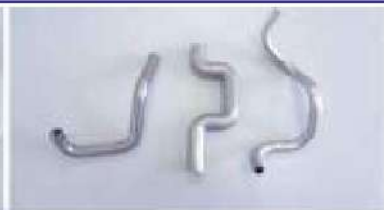
自動車排気ガス再循環用パイプ