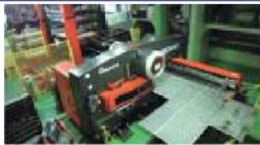
NCタレットパンチプレス