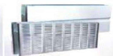
支柱隠蔽型吸音板