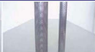
排気ガス低減装置用バンチングパイプ