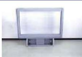
アミューズメント機器部品