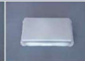
パワーコンディショナー角絞り部品