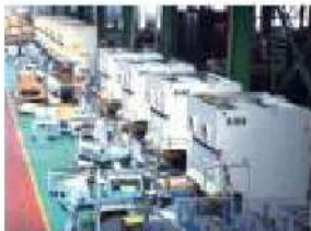
200mmワイドプレスライン(8連)