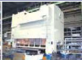
800tトランスファープレス