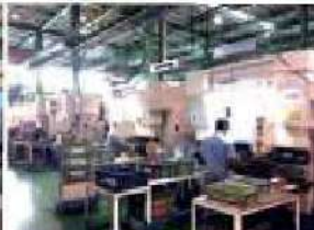
NCベンダーライン(5連)