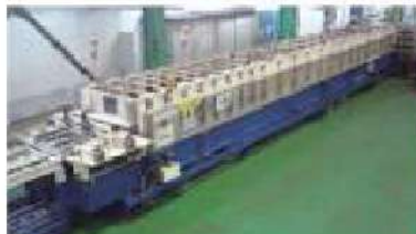
ロールフォーミング成形機