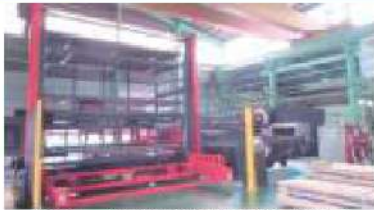
パンチ・レーザ複合加工機(1500×4000mm材対応)