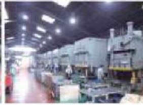
200tワイドプレスライン