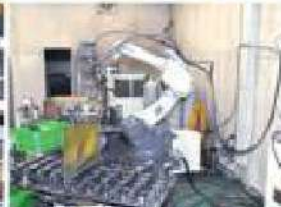
ファイバーレーザー溶接ロボット