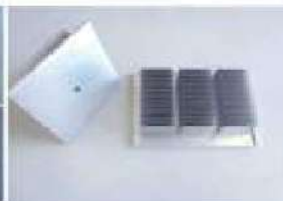
板金製作によるヒートシンク