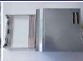
IHクッキングヒーター