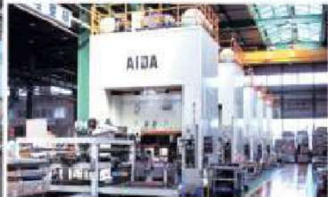
搬送ロボット付500tプレスライン