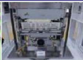
複合機処理ユニット