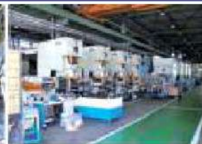
150tラインベアサー付プレス