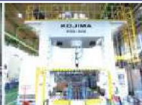
500t油圧式大型プレス