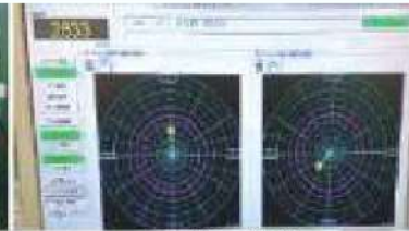
アンバランス測定器