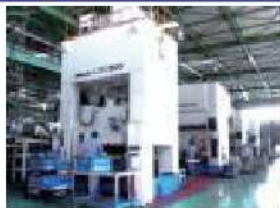
300tリンクモーションプレスライン