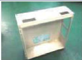
電気・電子機器収納キャビネット