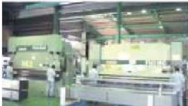
NCプレスブレーキ(300t・160t 4000mm対応)