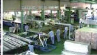
統一型吸音板組立ライン